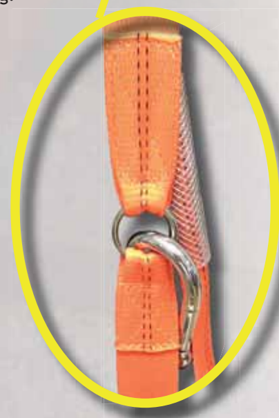
Detaljbild av belastad del utan synbar åverkan.