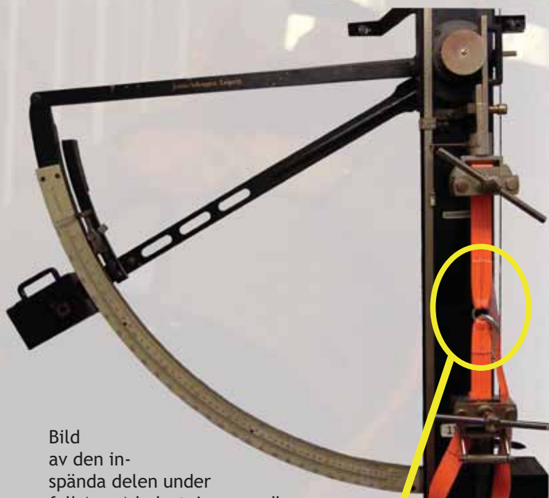
Bild av den inspända delen under full (max) belastning, mer än 250 kg, i tillgänglig utrustning.